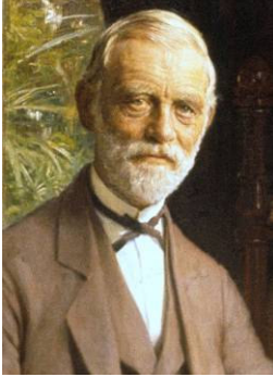
J.C. Jacobsen 1811 - 1887