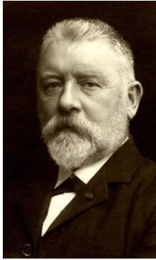
Carl Jacobsen 1842 - 1914