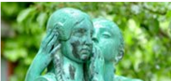
Скульптурный парк Подарки от Нового Карлсберг Фонда