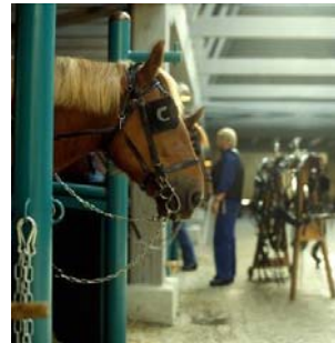
Конюшня. Карлсберг сохранил группу лошадей Ютланской породы