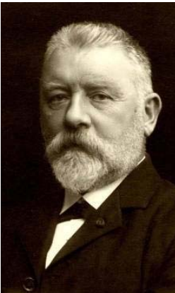
Carl Jacobsen 1842 - 1914

Карлсберг была первая рационально-технически оборудованная баерская пивоварня в Дании, что безусловно обеспечило успех и быстро утвердило интернациональную репутацию основателя как новатора в пивоварном мире.