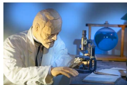
Лаборатория. Карлсберг и наука